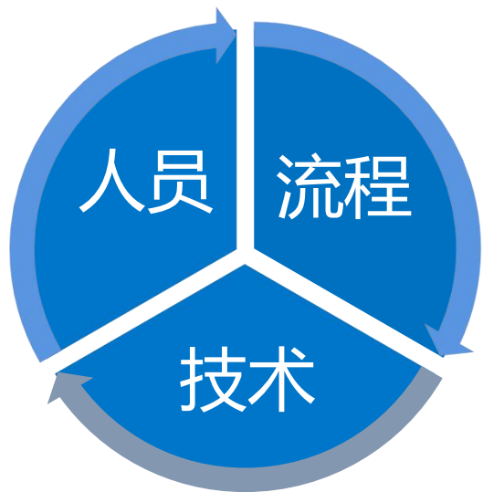
建设粮库智能监管线上平台

帮助纪委和粮食主管单位进行 常态化监督检查 、提升粮食安全整治效果，提高纪委和粮食主管单位进行监督指导能力，提升粮食公司的粮食安全风险预防能力，避免安全事故发生。