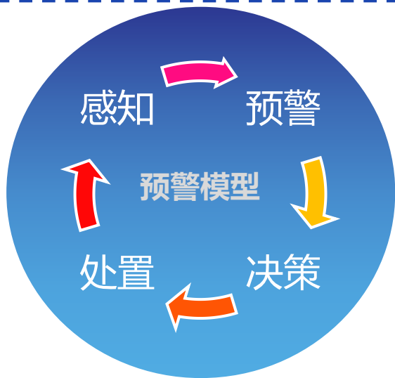
大数据分析预警平台